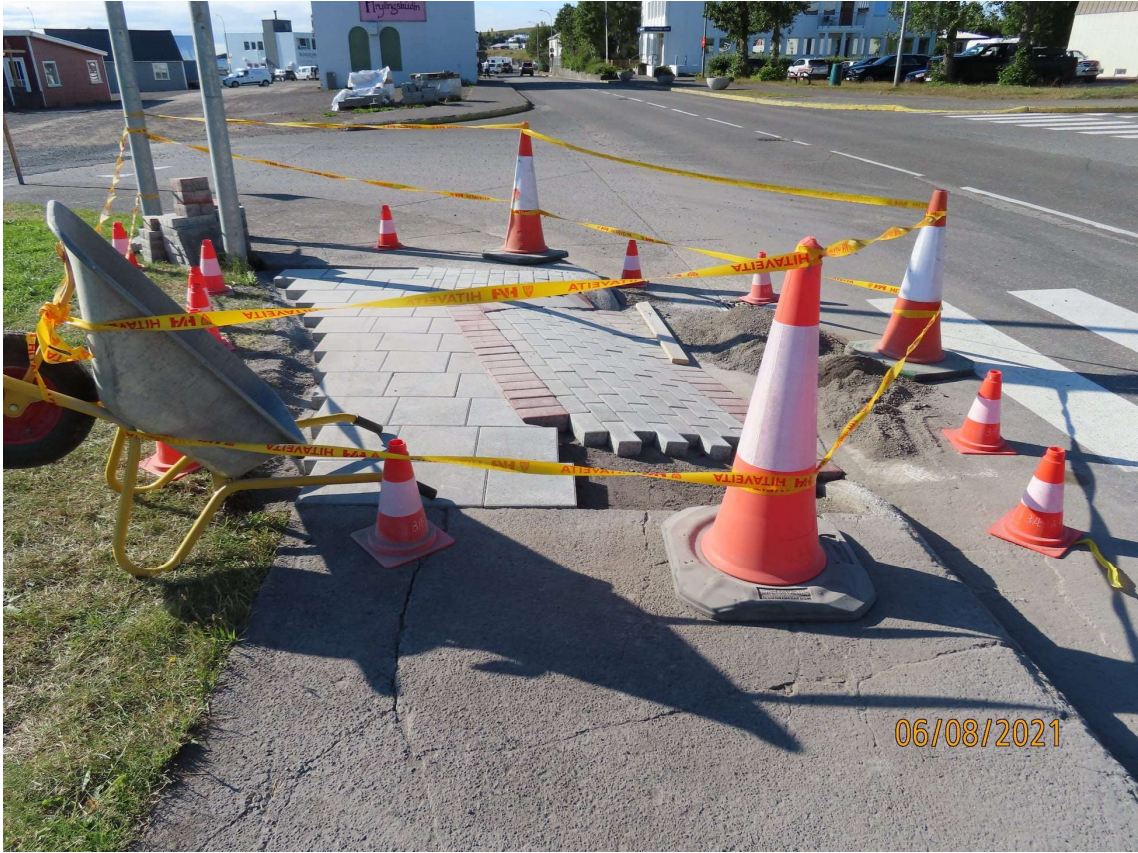
Gerð niðurtektar handan gangbrautar yfir Garðarsbraut.