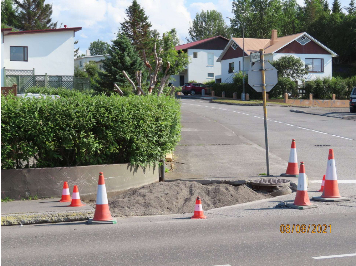
Niðurtekt á horni Garðarsbrautar og Hjarðarhóls