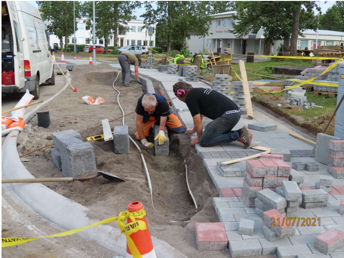
Starfsmenn Bæjarprýði að störfum neðan Naustsins á Garðarsbraut.