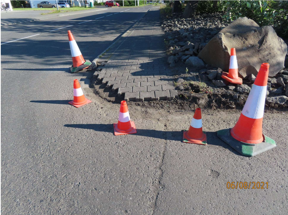
Bæjarprýði er víða um bæinn í viðgerðum á gangstéttum og kantsteinum.