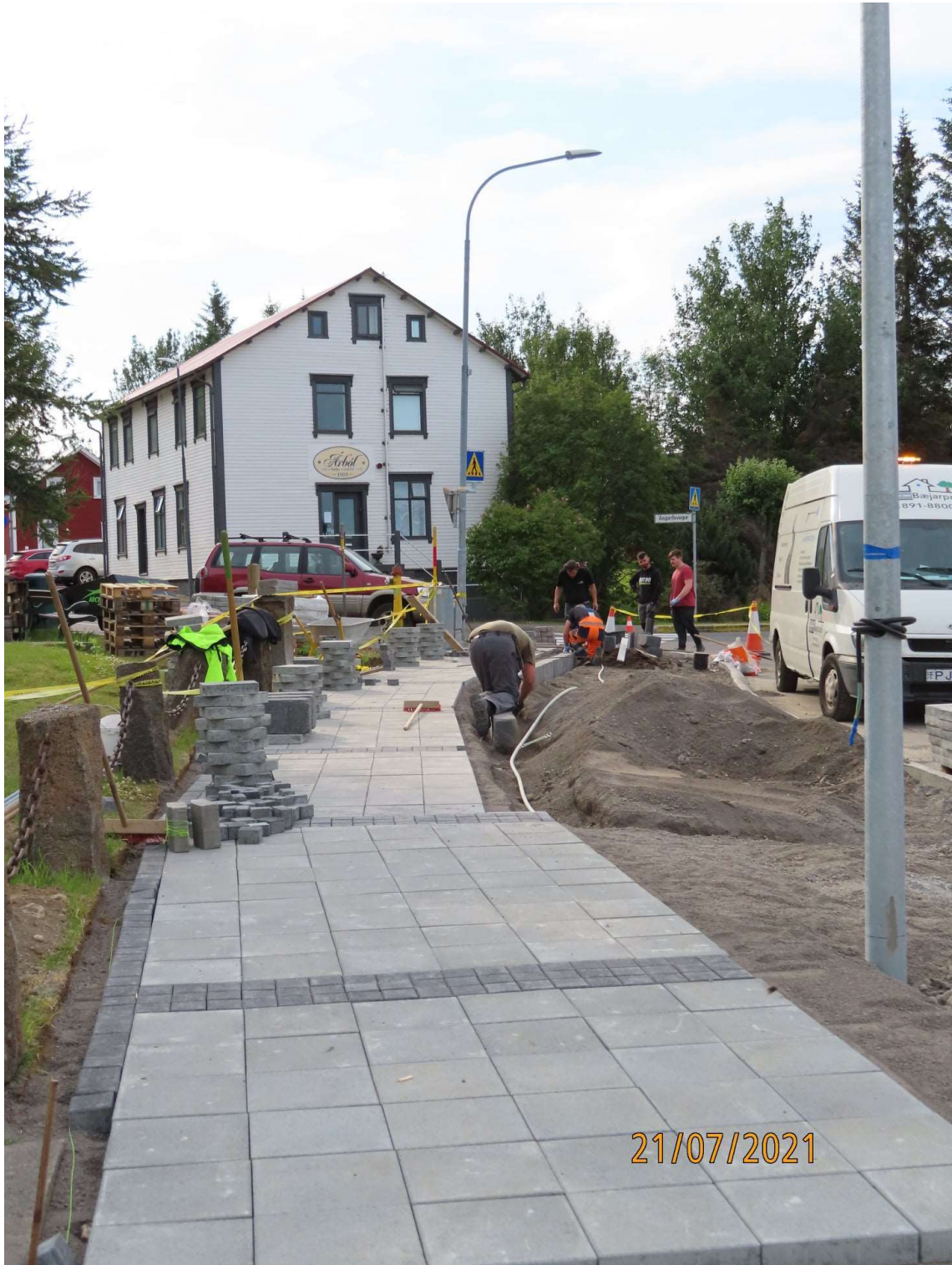
Framkvæmdir í gangi á Garðarsbraut norðan Ásgarðsvegar.