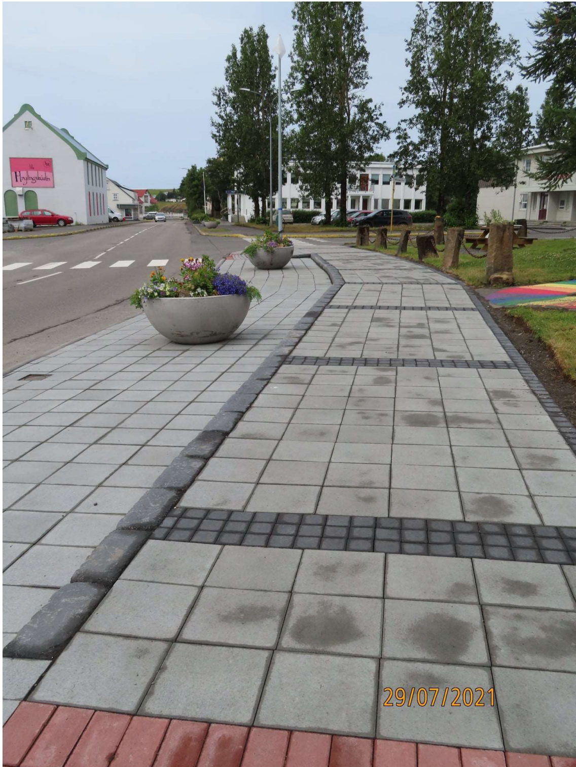
Endurnýjuð gangstétt við Garðarsbraut, niðurtekt hefur síðar verið gerð handan götunnar.